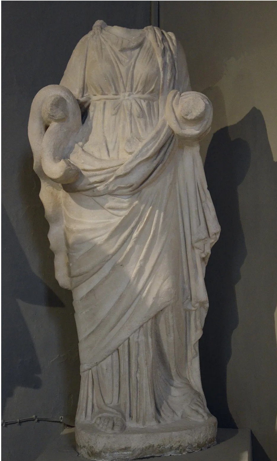
Άγαλμα της Θεάς Υγείας από το Γυμνάσιο της Σαλαμίνας, 2ος αιώνας μ.Χ., Κυπριακό Μουσείο