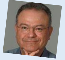
Γράφει ο Βασίλης Σταθόπουλος Μέλος Δ.Σ. του Ο.Σ.Α. και της Ε.Ο.Ο.

Συγχαρητήρια στον ΟΣ Αρκαδίας για την πρόθεση και υλοποίηση της ημερίδας για το «προφίλ του νέου Οδοντίατρου», που προσωπικά πιστεύω ότι πρέπει να αναδειχθεί άμεσα. Μια πρόταση θα ήταν προκειμένου να υπάρξει διάλογος αντί μόνον εισηγήσεων που παρακολούθησαμε να υπήρχαν 15λεπτές εισηγήσεις και στη συνέχεια ανταλλαγή απόψεων με τους συμμετέχοντες χωρίς να υποβαθμίζεται με την υποσημείωση αυτή η ιστορικής σημασίας σημερινή πρωτοβουλία.