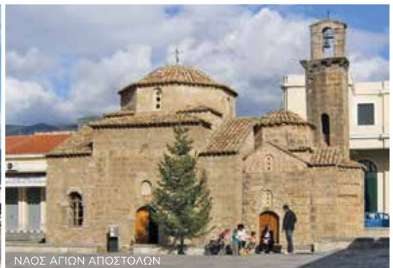
ΝΑΟΣ ΑΓΙΩΝ ΑΠΟΣΤΟΛΩΝ